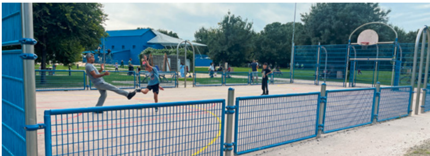
Le terrain multisports de l'île Forget a été restauré