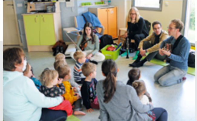
Animation musicale par l'école de musique

► Programme complet sur saintsebastien.fr