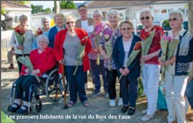
Les premiers habitants de la rue du Bois des Faux