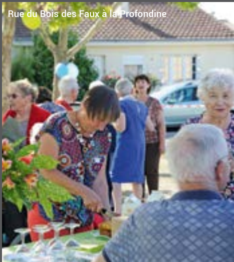
Rue du Bois des Faux à la Profondine

Après deux années de pause, les Sébastiennois de tous âges sont nombreux à organiser des repas conviviaux dans le cadre du "Rendez-vous des voisins". Avec le soutien de la Ville, qui met à disposition un kit de communication et apporte un verre de l'amitié, ce sont en tout plus de 75 quartiers ou rues qui se rencontrent de mai à septembre.