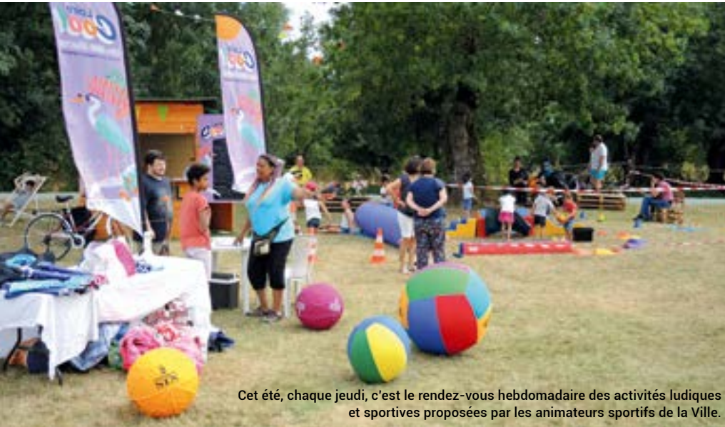
Cet été, chaque jeudi, c'est le rendez-vous hebdomadaire des activités ludiques et sportives proposées par les animateurs sportifs de la Ville.

Depuis 2018, élus et agents réfléchissent chaque été à la réalisation d'un programme d'animations estivales, originales, familiales et gratuites. Une prouesse possible grâce à l'implication de tous.