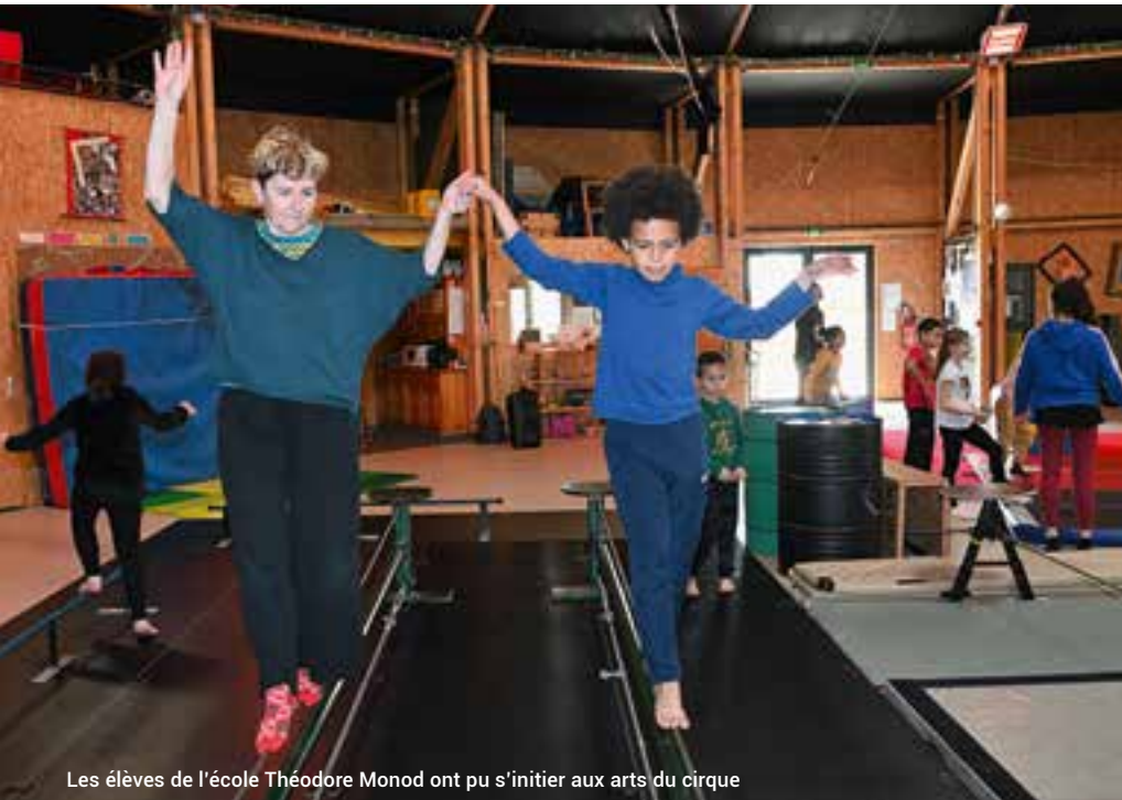
Les élèves de l'école Théodore Monod ont pu s'initier aux arts du cirque

Chaque année, la Ville apporte un soutien financier important aux projets d'animation ou séjours organisés par les écoles publiques et privées. Des moments de partage et de découverte essentiels pour les enfants et leurs enseignants.