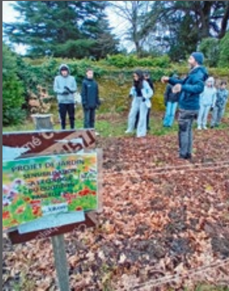
Quatre jardins sont en cours d'aménagement

Les éco-délégués (une trentaine d'élèves de différentes classes) se sont engagés cette année sur deux thématiques durables : la consommation responsable/gestion des déchets et la mise en valeur de la biodiversité du parc du lycée. Cette volonté fait écho à divers projets transversaux tels que la création de quatre jardins pédagogiques, un partenariat avec la fondation Tara Océan des déchets macro plastiques sur le littoral maritime et l'étude des bioplastiques ou encore le nettoyage des bords de Loire.